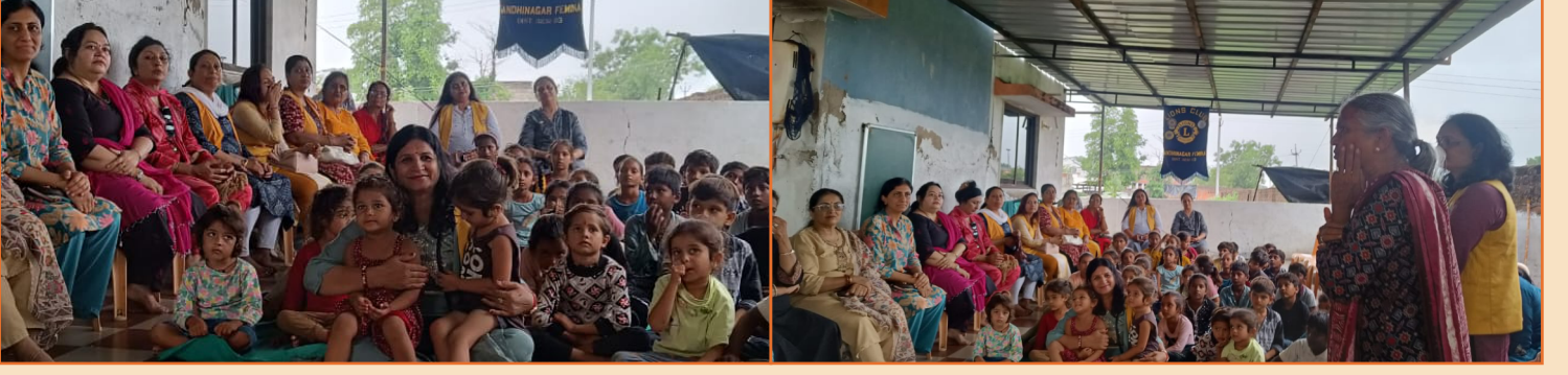
શિવમ અનાથ આશ્રમમાં શેડ - પરમેનન્ટ પ્રોજેક્ટ