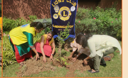
“વિશ્વ પર્યાવરણ દિવસ” નિમિત્તે વૃક્ષારોપણ